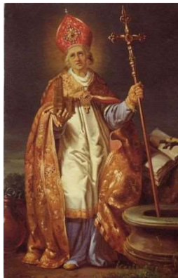
De Heilige St. Willebrordus

VLISSINGEN - Er bestaan veel theorieën over hoe Vlissingen aan die bijnaam komt, maar geen enkele is bewezen. De meest geloofde is het verhaal van Willibrord. Hij kwam in Walcheren aan land om de Zeeuwen te kerstenen, te bekeren tot het christendom. Hij bood bedelaars zijn fles aan, maar die fles raakte nooit leeg. Het kerstenen mislukte, Willibrord ging weg en liet zijn fles achter. Vanaf dat moment kennen we Flessingen (Vlissingen).